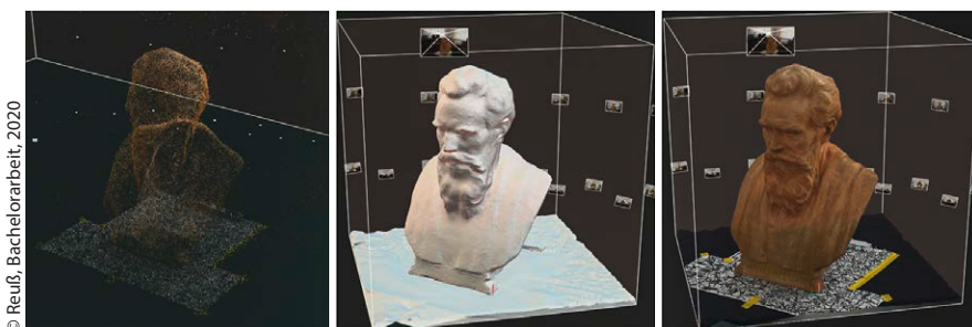
Rekonstruktion der Büste von Conrad Röntgen als dünne Punktwolke, als Polygonnetz und texturiertes Modell (v. l.)

allgemeinen Einschränkungen durch die Covid-19-Pandemie konnte diese Veranstaltungsreihe mit der gewohnten Teilnehmerzahl auch in diesem Jahr fortgeführt werden. In diesem Jahr wurde die Veranstaltung durch das Bildungswerk VDV, Fachgruppe 7 »Scan- und Bildmesstechniken«, die Deutsche Gesellschaft für Photogrammetrie, Fernerkundung und Geoinformation (DGPF), den AK »Aus- und Weiterbildung« und die Hochschule Würzburg-Schweinfurt (FHWS), Studienbereich Geo als hybride Veranstaltung durchgeführt. Mehr als neunzig Teilnehmer und Referenten nahmen online und zehn vor Ort in Würzburg an der FHWS teil.