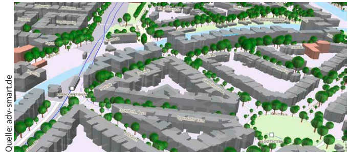
Visualisierung amtlicher Geodaten

werden kann, da z. B. die Realisierung von Planungsvarianten oder die Visualisierung anderer CityGML-Objektarten wie Stadtmöblierung weiterhin nur mit Ci-