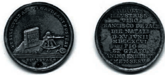
Abb. 2: Die Medaille für Zach

Im Münzkabinett des Kunsthistorischen Museums Wien ist die Medaille allerdings nicht vorhanden; offenbar wurde sie bei der damaligen Versteigerung nicht angekauft 25 . Die Suche in Prag erbrachte schließlich den Treffer. Das Nationalmuseum besitzt sie und aus dessen Besitz bilden wir sie hier ab: