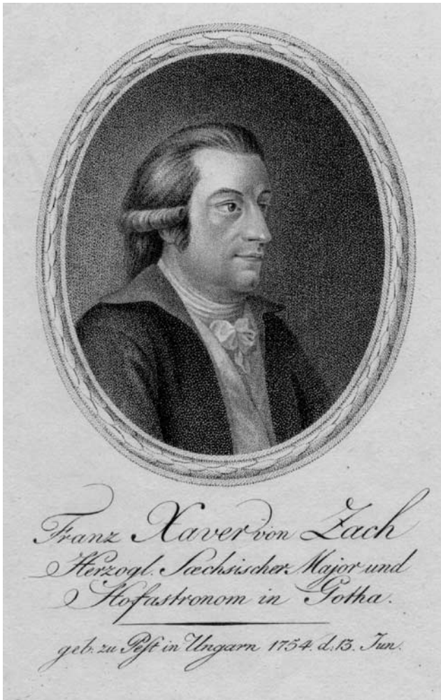
Abb. 1: Franz Xaver von Zach (Neue allgemeine deutsche Bibliothek Bd. 49, 1. Stück, Kiel 1800, Frontispiz)

man einen mit Füßchen ausgestatteten Sextanten direkt auf den künstlichen Horizont stellen.